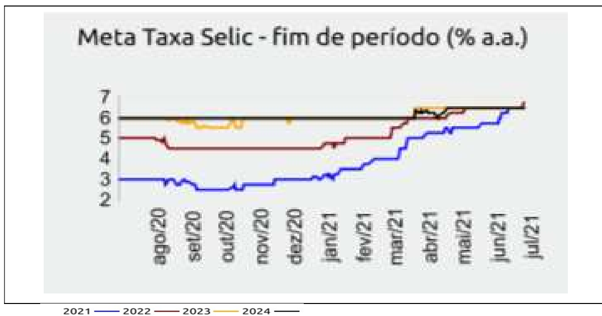
Figura 4: Projeções da Taxa de Juros Selic (% a.a.)